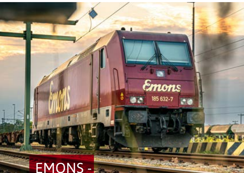
EMONS - RAIL-CARGO GMBH